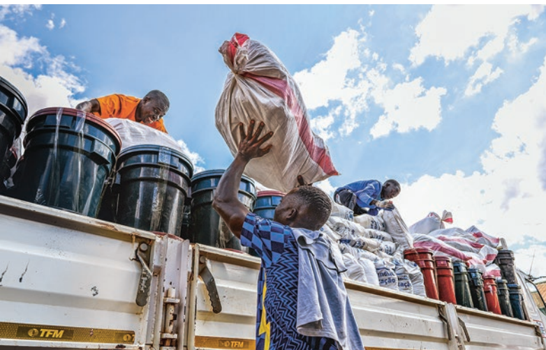
Die Hilfsgüter werden auf Lastwagen zu den Geflüchteten gebracht.

Gewaltsame Zusammenstöße in der Provinz Nord-Kivu haben mehr als 190.000 Menschen zur Flucht gezwungen. Die Schutzsuchenden haben vor allem die Gebiete Rutshuru und Nyiragongo verlassen. Die Massenvertreibung verschärft die ohnehin schwierige Lage der Bevölkerung. Vielen Menschen mangelt es an Nahrung, angemessenen Unterkünften und medizinischer Behandlung. ÄRZTE OHNE GRENZEN unterstützt mehrere Gesundheitszentren in der Region, hat zwei provisorische Kliniken aufgebaut und hilft bei der Verbesserung der Wasserversorgung und sanitären Anlagen.