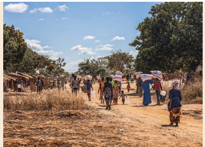
Allein in dem Ort Mumane haben mehr als 500 Familien Hilfspakete erhalten.