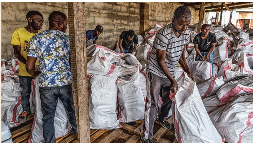
Unsere Mitarbeiter*innen in Cabo Delgado packen Hilfspakete für Vertriebene.

Eine Welle der Gewalt hat im Sommer im Nordwesten von Mosambik weitere 80.000 Menschen vertrieben. Damit sind inzwischen mehr als 900.000 Menschen innerhalb der Landesregion auf der Flucht. ÄRZTE OHNE GRENZEN hat sofort reagiert und mehr als 4.000 vertriebene Familien mit Hilfsgütern versorgt – darunter Decken, Planen und Wasserbehälter. An neun verschiedenen Orten im Süden der Provinz Cabo Delgado teilten unsere Teams Hilfspakete aus. Im nördlichen und zentralen Teil der Provinz setzen wir zudem unsere Projekte fort, die wir in teils schwer erreichbaren Gebieten seit Jahren betreiben.