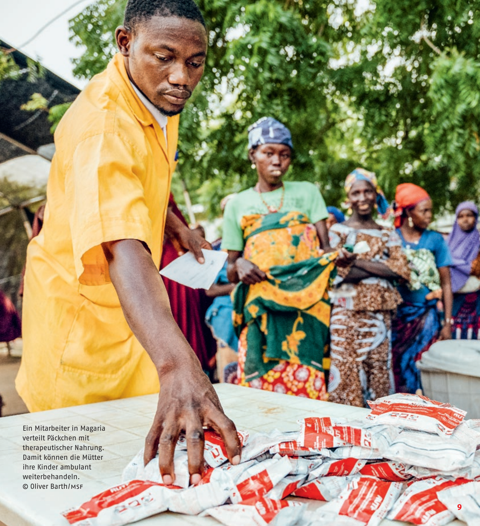
Ein Mitarbeiter in Magaria verteilt Päckchen mit therapeutischer Nahrung. Damit können die Mütter ihre Kinder ambulant weiterbehandeln.