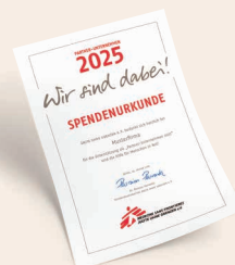
Urkunde zum Aushang

Zur Nutzung wird eine kurze Vereinbarung mit Ihnen geschlossen. Die Darstellung als Partner-Unternehmen darf beispielsweise nicht zur Bewerbung von Produkten genutzt werden oder zentraler Bestandteil einer Marketingkampagne sein.