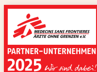
Ihr Partner-Logo 2025

Mit den Materialien können Sie Ihr Engagement gegenüber Ihrer Kundschaft, Geschäftspartner*innen und Mitarbeitenden sichtbar machen, z.B. auf Ihrer Webseite oder in Ihrer Briefpost. Viele Dateien sind auch auf Englisch verfügbar.