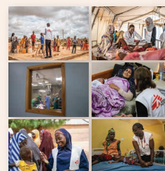
Fotos und Informationen zu ausgewählten Projekten