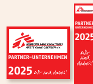
Internetbanner und E-Mail-Signaturen