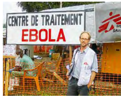
GUINEA: Maximilian Gertler © MSF