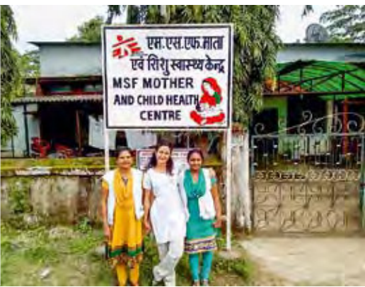
INDIEN: Parnian Parvanta © MSF